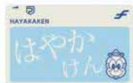
はやかけん (福岡市交通局)