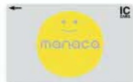
manaca (名古屋交通開発機構・エムアイシー)