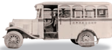
1926-30(昭和初期)頃 乗合バス