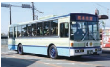
2013(平成25)年 復刻カラーバス