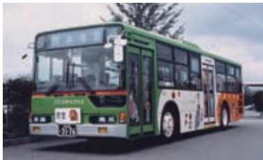
1997(平成9)年 ノンステップバス