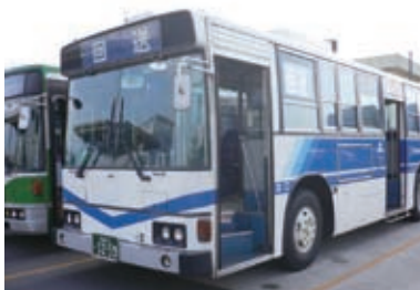
1998(平成10)年 貸切(競輪専用)バス