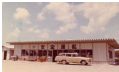
1969(昭和44)年 坪井営業所