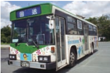
1990(平成2)年 動物園カラーバス