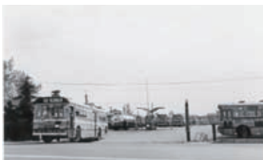
1961(昭和36)年 帯山営業所