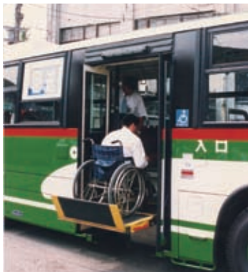
1994(平成6)年 リフト付きバス