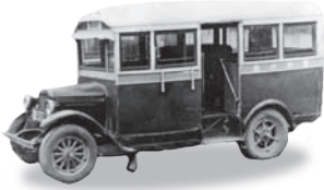
1928(昭和3)年 シボレーバス