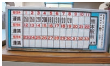
巻取り式運賃表示器