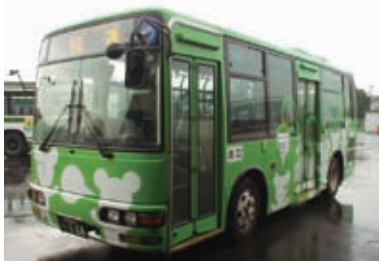
2001(平成13)年 都心循環(ゆうゆう)バス