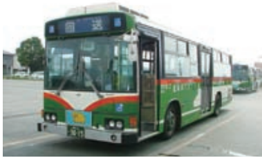
1995(平成7)年 スロープ付き超低床バス