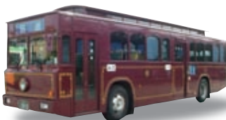
1993(平成5)年 レトロ調バス