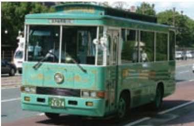
1992(平成4)年 熊本城周遊バス