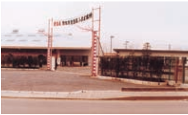
1979(昭和54)年 小峯営業所