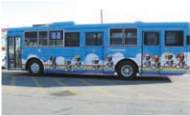
2006(平成18)年 貸切(競輪専用)バス